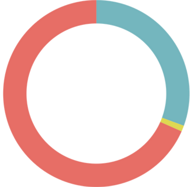
Investimenti 2003 - 2018