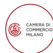
Camera di Commercio di Milano