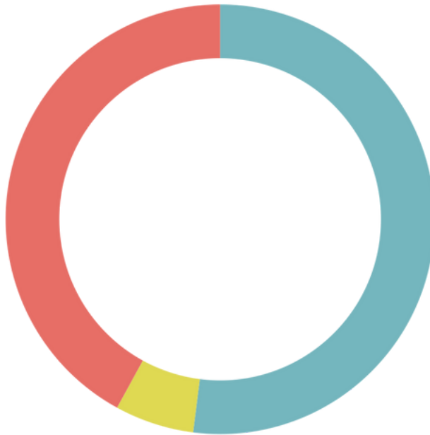
Investimenti 2019 - 2024