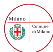
Comune di Milano